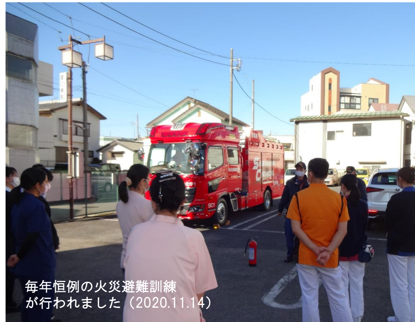
毎年恒例の火災避難訓練 が行われました (2020.11.14)